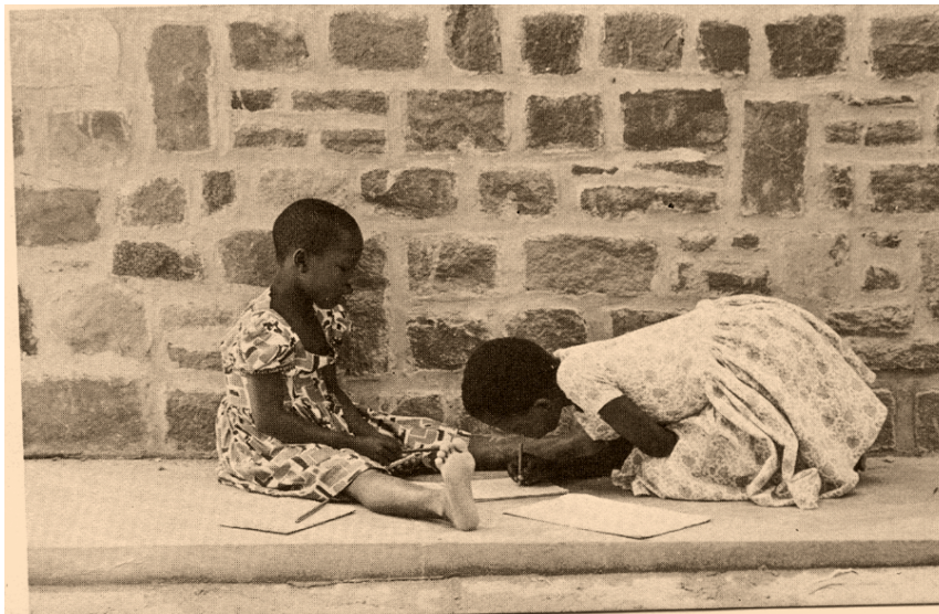
ምሥል 4.1. ምቹ የመማሪያ ሥፍራ ያላገኙ ልጆች