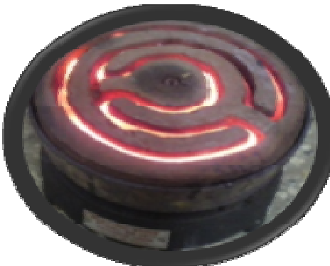
ምሥል 4.3 የኮራንቲ ምድጃ

ኮራንቲ ብርሃን ለመስጠት፣ ሙቀት ለማስገኘትና ሞተሮችን ለማንቀሳቀስ ይጠቅማል። ይህ በጣም ጠቃሚ ቴክኖሎጂ ከፍተኛ አደጋ የማድረስ ወይም ጥፋት የመፍጠር አቅም አለው። የኮራንቲ ፍሰትን ጥቅም ላይ ለማዋል በመዳብ ሽቦዎች እንጠቀማለን። ሁሉም ብረት ነክ ነገሮችና እርጥብ ነገሮች የኮራንቲ ፍሰትን ያስተላለፋሉ። የኮራንቲ ፍሰት በሰው አካልም ይተላለፋል። ስለዚህ የኮራንቲ ፍሰት የሚያስተላልፉ የፕላስቲክ ሽፋን የሌላቸውን ሽቦዎች መንካት፣ ሽቦዎችን በእጅ ማገናኘት፣ በእርጥብ እንጨት የተላጡ የኮራንቲ ሽቦዎችን መንካት እንዲሁም የመብራት ቆጣሪን ሳያጠፉ በድፍረት የኮራንቲ ገመዶች መቀጠል፣ መጠጠስ እንዲሁም በኮራንቲ ኃይል የሚሠሩ ዕቃዎችን በእርጥብ እጅ መንካት በሕይወት ላይ ከፍተኛ አደጋ ያስከትላል። ስለዚህ የተላጡ ሽቦዎችን ከመንካት መቆጠብ አለባችሁ። ድንገት የተላጡ ሽቦዎች ቢገኙ ወዲያውኑ ለአዋቂዎች ወይም ለሚመለከታቸው ሰዎች መንገር ይገባችኋል። በእርጥብ እንጨት ወይም ውኃ በነካ እጅ በኮራንቲ የሚሠሩ ዕቃዎችን ወይም የኮራንቲ ሽቦዎችን ከመንካት መቆጠብ አለባችሁ። የተላጠ የኮራንቲ ሽቦ ካለበት አካባቢ ራሳችሁን በማራቅ ከአደጋ ማምለጥ ትችላላችሁ።