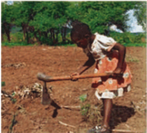
ከዚህ ምሥል ምን ትረዳላችሁ?