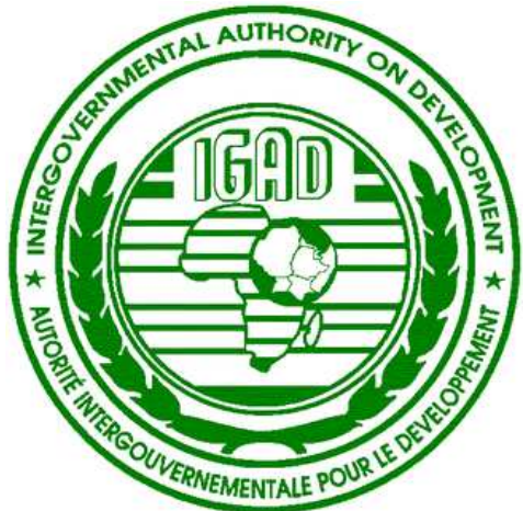
ምሥል 4.5 የኢጋድ አርማ

ይህ ድርጅት የተቋቋመው እ.ኤ.አ. በ1986 ዓ.ም ነበር። ይህ ክፍለ አኅጉራዊ ድርጅት የተቋቋመው ሁሉም የምሥራቅ አፍሪካ ሀገሮች ከፍተኛ ድርቅ ባጋጠማቸው ወቅት ነበር። በዚያን ወቅት ከድርጅቱ ዓላማዎች አንዱ ድርቅ ያስከተለውን ችግር መቋቋም ነበር። ስለዚህ የድርጅቱ ስያሜ ልማትን የሚያራምድና ድርቅን የሚቋቋም በሀገሮች የጋራ ትብብር የተቋቋመ ድርጅት የሚል ነበር። ስያሜውም በዚህ (IGADD) ምሳሌ ቃል ይታወቅ ነበር። በኋላ ግን ድርጅቱ ድርቅ ላይ ብቻ ሳይሆን የክፍለ አኅጉሩን ችግሮች ለመፍታት በልማት ተግባራት ላይ አተኩሯል። ስለዚህ ከስያሜው ውስጥ “ድርቅ” የሚለውን አስወግዷል። በመጀመሪያ የድርጅቱ አባል ሀገሮች ቁጥር ስድስት ነበር። እነርሱም ጂቡቲ፣ ኢትዮጵያ፣ ኬንያ፣ ሶማሊያ፣ ሱዳንና ዩጋንዳ ነበሩ። ኤርትራ ራሷን ችላ አገር ሆና መኖር ከጀመረችበት ጊዜ አንስቶ ግን የኢጋድ አባል አገሮች ቁጥር ሰባት ደርሶ ነበር። ነገር ግን ኤርትራ ራሷን ከድርጅቱ አግልላለች።