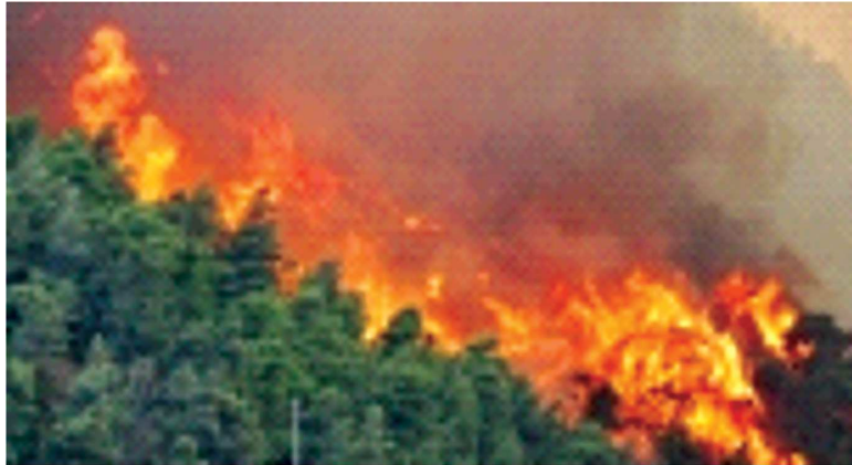
ምሥል 4.4 የደን ቃጠሎ

የስልክ ጥሪ ማድረግ አስፈላጊ ነው። ይህን ጥሪ ለማድረግ የእሳት አደጋ መከላከያን የስልክ አድራሻ በቃል መያዝ ይጠቅማል።